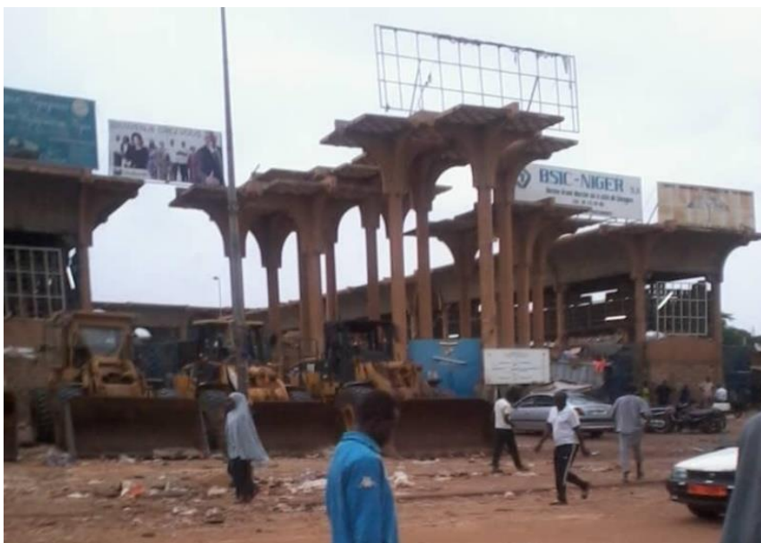
Photo 1 : Devanture du Grand Marché après la destruction des kiosques par les bulldozers et quelques décombres

La seconde phase de déguerpissement 8 a commencé en septembre. Ainsi, le 5 septembre 2016, l'opération intervient sur les voies et prolongement de l'ONEP jusqu'à la place de la concertation, la seconde, de la maternité Gazobi en passant par l'immeuble de la CNSS jusqu'à l'hôtel des postes et la troisième, au niveau des écoles primaires terminus 1 et 2 jusqu'à l'office nationale du tourisme (confer carte ci-dessous). À la même date, à 00h30 mn, les kiosques autour du Grand Marché ont été déguerpis. En effet, plus de 2000 kiosques autour du grand marché ont été démolis (photos 1) et le marché a été fermé pendant 48h 00. L'opération s'est poursuivie jusqu'au 29 Septembre où plusieurs grandes artères de la capitale envahies par les vendeurs de rue et de véhicules d'occasion ont été déguerpis. L'application d'un nouveau arrêté 9 le 30 septembre 2016 abrogeant celui du 23 août de la même année, donne un délai d'un mois aux détenteurs des kiosques de quitter les lieux.