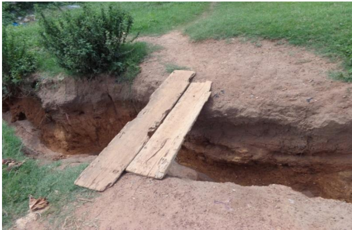
Photo 3 : Voie interrompue par les eaux pluviales à Sossonoubougou (Belleville 2, Cliché de Traoré Fanta, 2016)

Quant aux autres eaux usées domestiques (eau de vaisselle, de lessive), elles sont généralement déversées dans les rues ou dans les ouvrages de drainage des eaux pluviales. La photo n°3 nous montre un pont de fortune permettant de rejoindre les deux parties du quartier Sossonoubougou Belleville 2 séparé par un fossé creusé par les eaux de ruissellement. Ce fossé permet de drainer des eaux usées qui restent des vecteurs de maladies pour les populations.