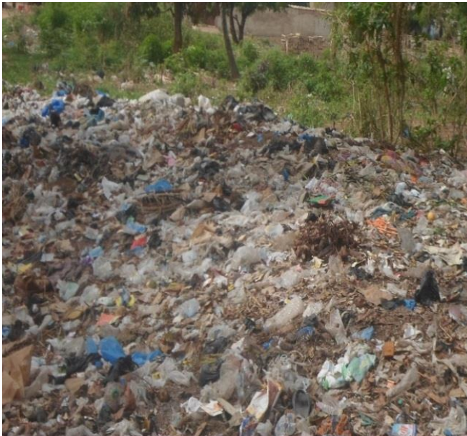
Photo 1 : Dépôt sauvage au quartier Kaba usine

Comme en témoignent les photos 1 et 2, les cadres de vie des populations sont fortement insalubres. C'est ce qui expose les habitants à des problèmes de santé dus à des agents pathogènes. On compte parmi ces pathologies, les troubles respiratoires, les problèmes de circulation sanguine, les maladies dermatologiques, etc. A cela, il faut ajouter les maladies diarrhéiques, la fièvre typhoïde, le paludisme, etc. (Traoré, 2007). Toutefois, le degré d'insalubrité reste variable d'un quartier à un autre. Celle-ci s'évalue en fonction des pratiques environnementales observées chez les chefs de ménage à savoir les modes d'évacuation des eaux usées et des ordures ménagères.