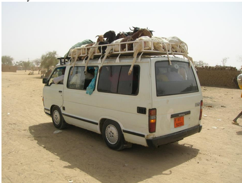
Photo n°1 : Petits ruminants achetés au marché de Gothèye en partance pour Niamey

La situation géographique de Gothèye à la périphérie de la capitale politique et économique du pays et sa position dans la région de Tillabéri lui accordent certains avantages. En effet, distant de 78 km, la métropole Niamey exerce une influence déterminante sur l'activité du centre, d'autant que son accessibilité est remarquable : bonne route revêtue et rectiligne de 6 m de large, 4 à 10 liaisons quotidiennes par bus, taxis et mini-bus communément appelés 19 places (photo n°1).