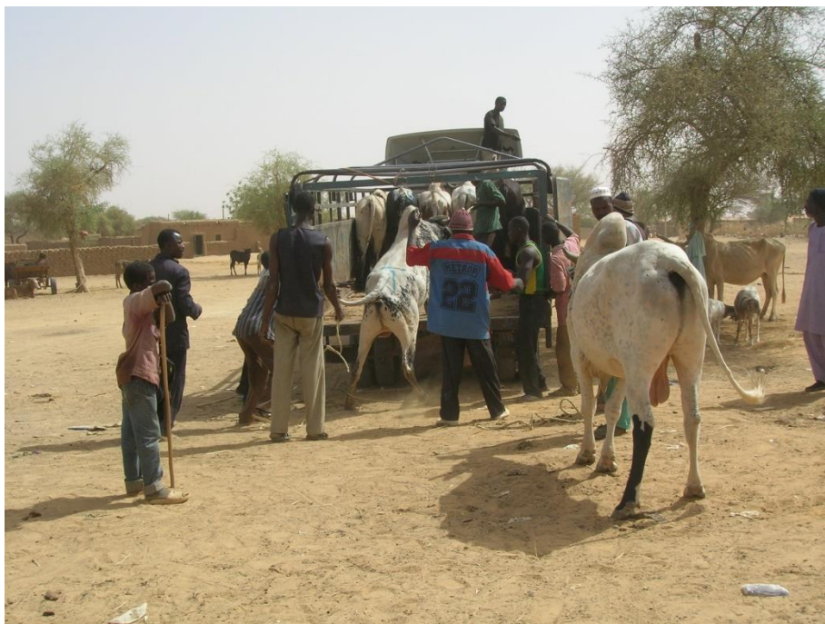
Photo 3 : Chargement de bétail dans un camion au marché de Gothèye

Niamey (photo n°3), un acheminement qui se faisait, il n'y a pas longtemps exclusivement à pied.