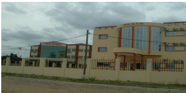
Cliché, R. NGOMEKA, 2014

Photo 1 : Les sièges des hôtels du plan et du conseil départemental au centre-ville d'Ewo.